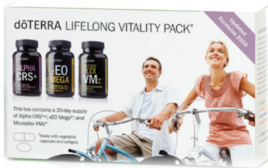
dōTERRA LIFELONG VITALITY PACK™ NAHRUNGSERGÄNZUNG MIT ALPHA CRS™+, MICROPLEX VMZ™ UND xEO MEGA™