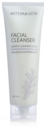
FACIAL CLEANSER 118 ml

Jedes Produkt der ätherischen dōTERRA Hautpflegeserie enthält die natürliche Kraft der ätherischer Öle, modernste Pflanzentechnologie sowie natürliche Pflanzenextrakte. So bleibt Ihre Haut sichtbar jünger, gesünder und geschmeidig! Bekämpfen Sie die sichtbaren Zeichen des Alterns gezielt mit der ätherischen dōTERRA Hautpflege.