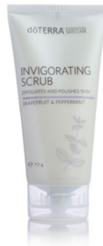
INVIGORATING SCRUB 70 g

Der dōTERRA Gesichtsreiniger enthält die CPTG™ ätherischen Öle Teebaum und Pfefferminze, die dafür bekannt sind, die Haut zu reinigen, zu festigen und ein gesundes Aussehen zu unterstützen. Die natürlichen Reinigungskräfte des Yuccawurzel- und Seifenrindenextrakts entfernen sanft den Schmutz und sorgen für ein sauberes, frisches und glattes Hautbild.