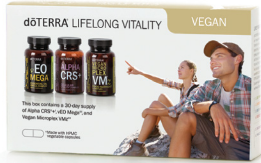
dōTERRA LIFELONG VITALITY VEGAN PACK™ NAHRUNGSERGÄNZUNG MIT ALPHA CRS™+, MICROPLEX VMZ™ UND vEO MEGA™