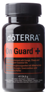
ON GUARD™+ SOFTGELS 60 vegetarische Weichkapseln

Mit seinem einzigartigen Aroma bietet On Guard eine duftende, natürliche und wirksame Alternative zu synthetischen Produkten.