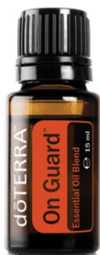
ON GUARD™ TOPSELLER ÄTHERISCHE ÖLMISCHUNG 15 ml

On Guard ist eine der beliebtesten und vielseitigsten dōTERRA™ CPTG™ ätherischen Ölmischungen von garantiert reiner, geprüfter Qualität. Die geschützte Kombination der ätherischen Öle Wildorange, Gewürznelke, Zimt, Eukalyptus und Rosmarin trägt effektiv zum Schutz Ihres Körpers und Ihrem Zuhause bei. Die On Guard-Mischung wurde in eine Vielzahl von dōTERRA-Produkten integriert, um ihrer starken Wirkung vielfältige Nutzungsmöglichkeiten zu bieten.